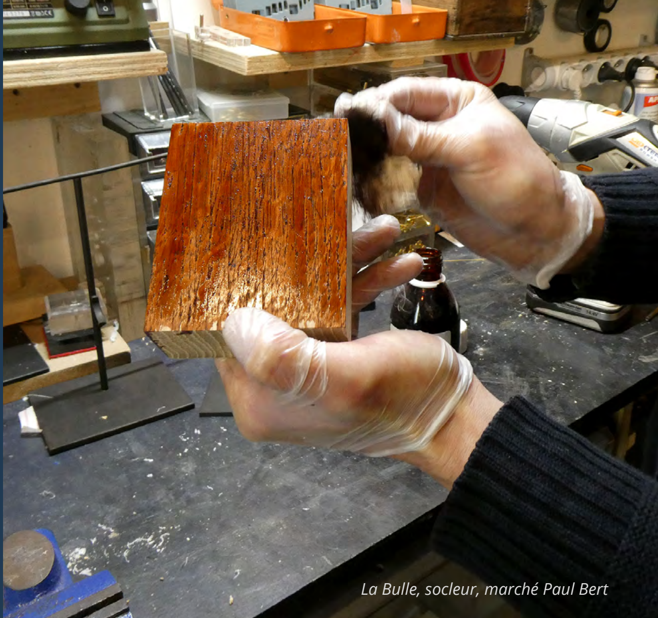
La Bulle, socleur, marché Paul Bert